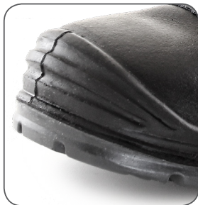
zesílená přední část proti okopu reinforced PU overcap przednia część wzmocniona PU